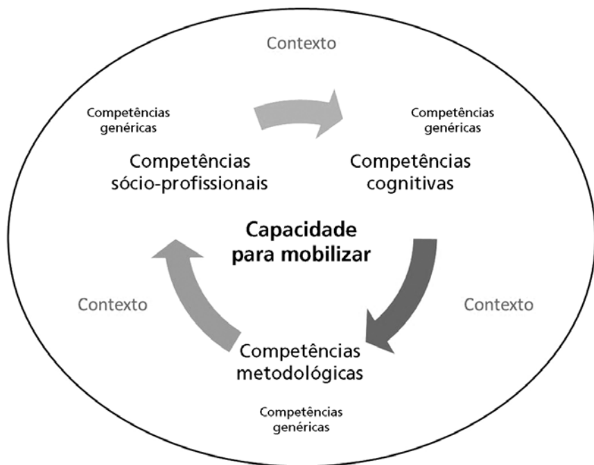
Figura 1 Fundamentos conceituais do meta-perfil do físico na América Latina

Em terceiro lugar, estudaram-se as inter-relações entre as competências genéricas e específicas para a Física e identificaram-se os pontos comuns entre elas. (seção 2.2)