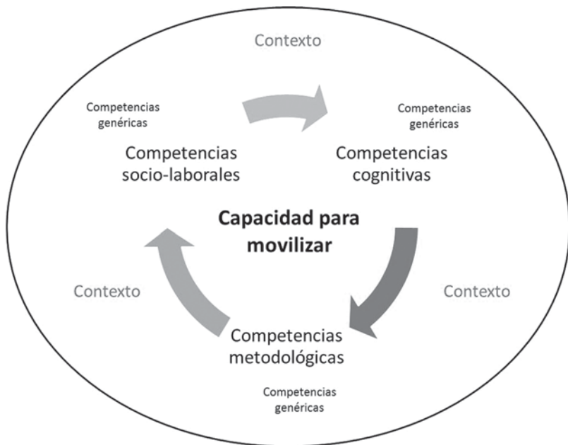
Figura 1 Fundamentos conceptuales del meta-perfil del físico en América Latina

En tercer lugar, se estudiaron las interrelaciones entre las competencias genéricas y las específicas para Física y se identificaron las coincidencias entre las mismas (Sección 2.2).